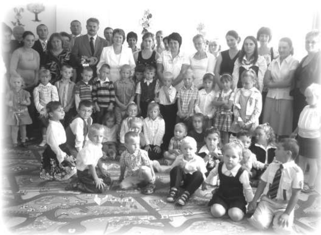
Pamiątkowe zdjęcie uczestników