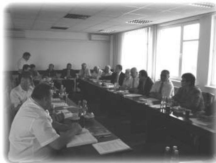
W Radzie Gminy zasiada 15 radnych