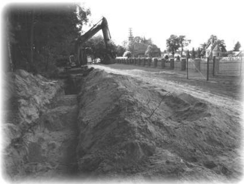
Rozpoczęła się już rozbudowa centrum miejscowości Ocieka

W ramach projektu „Przeciwdziałanie wykluczeniu cyfrowemu” złożono