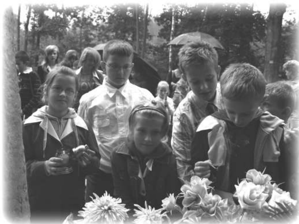
Uczniowie na zakończenie złożyli znicze i zapalili znicze

Dzisiaj jesteśmy wdzięczni tym wszystkim, których śmierć, przelana krew, cierpienie i poniesione trudy sprawiły, że żyjemy w wolnym kraju.