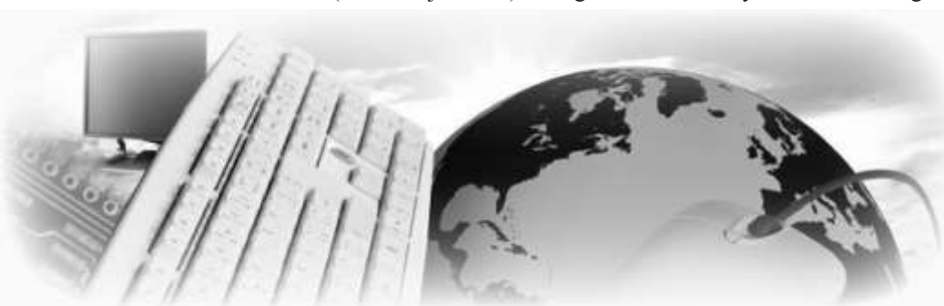
Urząd Gminy Ostrów złożył wniosek dzięki, któremu nawet 50 gospodarstw z naszej gminy może zostać wyposażone bezpłatnie w zestaw komputerowy z dostępem do Internetu.

Warto wspomnieć, że przedstawiłem tylko część inwestycji na jakie gmina pozyskała lub stara się pozyskać fundusze. Gdyż jak wiemy stadion w Ostrowie również dotrzymał dofinansowania czy też mieszkańcy Bliźny mogą liczyć na fundusze w celu zagospodarowania wioski.