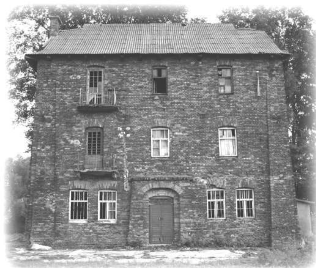
Młyn w Kozodrzy