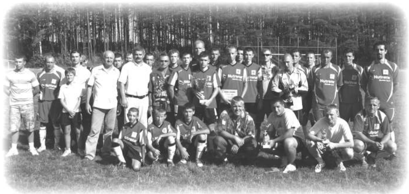
Pamiątkowe zdjęcie uczestników turnieju