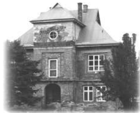
Budynek obok młyna

murowany, piętrowy budynek mieszkalny. Budynek jest otynkowany, ale mocno