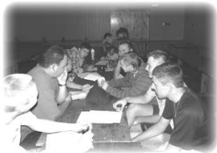
Zdjęcie z walnego zebrania dotyczącego założenia klubu piłkarskiego w Ostrowie