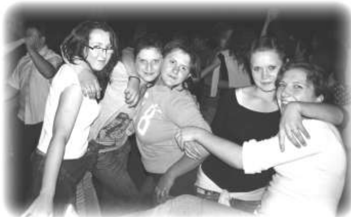
Końca zabawy nie było widać

Wszyscy którzy tego dnia odwiedzili zalew w Ka-