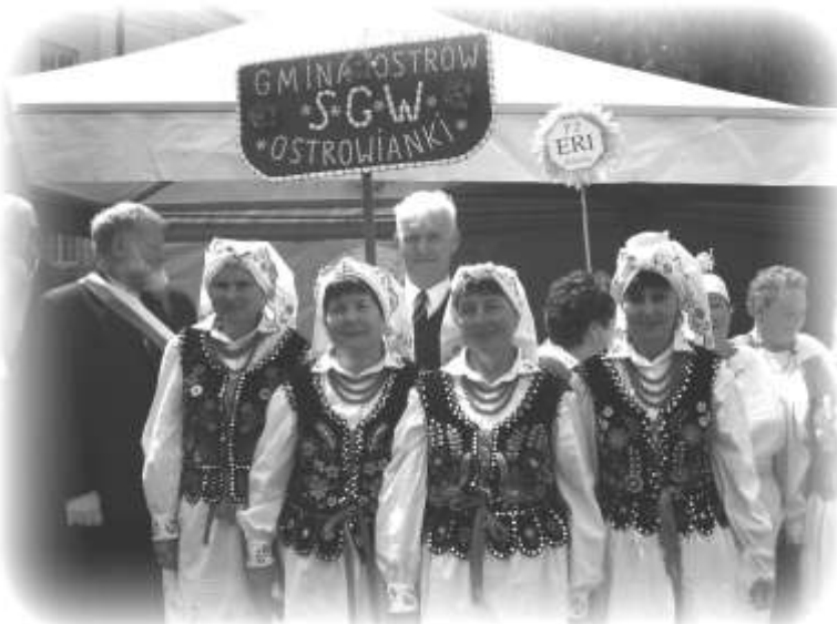
Grupa z Ostrowa

W II edycji konkursu "Dziedzictwo Kulturowe Podkarpacia" grupa z Ostrowa zdobyła wyróżnienie Podkarpackiego Ośrodka Doradztwa Rolniczego za nalewkę z