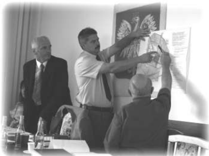
Dużo znaków zapytania pojawiło się podczas uchwały o wydzierżawienie nieruchomości w Kozodrzy...

Dębica w sprawie przygotowania potrzebnej dokumentacji, realizacji i rozliczenia projektu pn. „Park historyczny Blizna i Pustków – droga pamięci i pojednania”. Podjęto także uchwały o sprzedaży w trybie bezprzetargowym nieruchomości w Skrzyszowie oraz wydzierżawienie nieruchomości położonej w Kozodrzy. Następnie poddano głosowaniu zmianę zakresu wieloletnich programów inwestycyjnych przyjętych uchwałą z dnia 21 stycznia 2009 w sprawie budżetu gminy na 2009 rok. Ostatnimi dwoma punktami jakimi zajęła się Rada Gminy to sprawa zwiększenia planu dochodów oraz zwiększenia planu wydatków w budżecie Gminy Ostrow na rok 2009 a