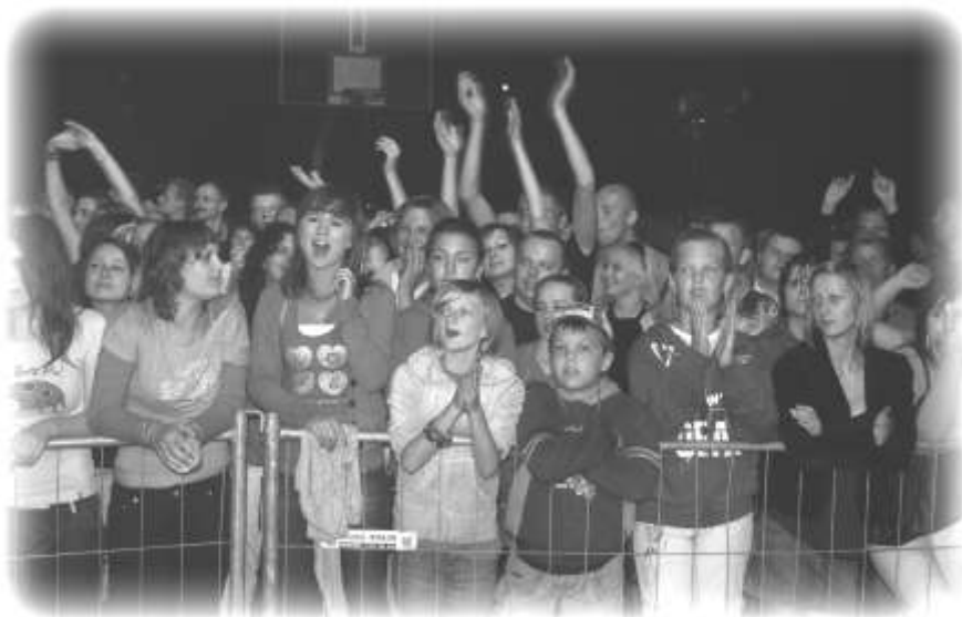
Publiczność kilka razy wywoływała gwiazdę gorącymi brawami

Gwiazdą tego wieczoru był BARTEK WRONA, znany m.in. z przebojów: „Jedna na milion”, „Maria”, „Barwy szczęścia” oraz „Mój Amsterdam”. Młodzież słuchała i nuciła dobrze znane piosenki, natomiast starsi