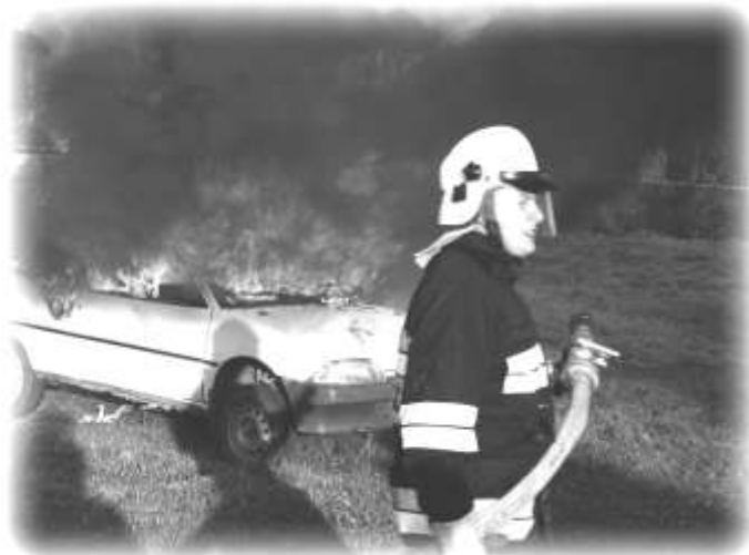
Gaszenie palącego się samochodu w wykonaniu strażaków z OSP w Skrzyszowie

które odpowiadają za bezpieczeństwo obywateli.