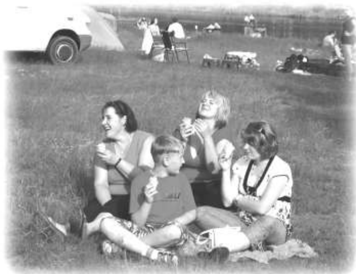
Odpoczynek nad zalewem przy muzyce

także o podniebienia w postaci słodkich, domowych ciast, pieczonych kiełbasek z grilla oraz napojów.