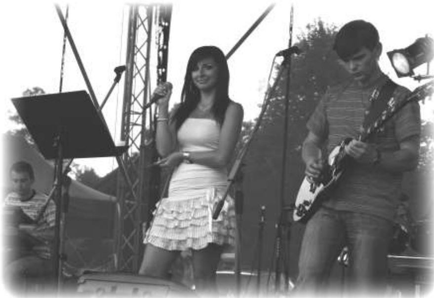
Zespół „Black Horse” był jednym z 7 zespołów, które wystąpiły tego dnia dla publiczności

Podczas trwania imprezy jedni śpiewali znane przeboje razem z artystami, inni bujali się w rytm muzyki płynącej ze sceny, a ci najbardziej odważni tańczyli tak jak potrafili. Pod sceną zgromadziło się w tym czasie setki ludzi, którzy przyjecha-