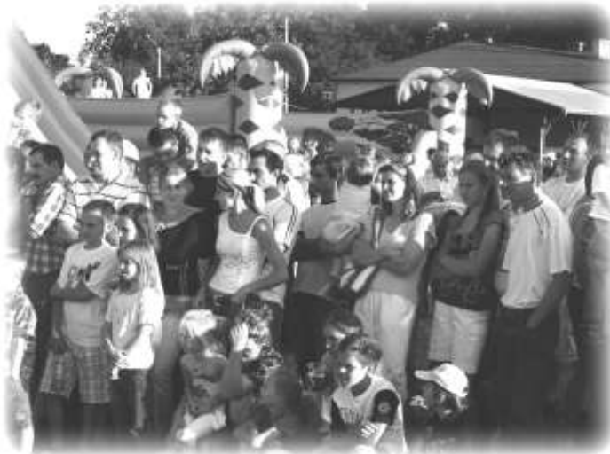
Z dużym zainteresowaniem wszystkie pokazy śledziła licznie zgromadzona publiczność

- zasadami bezpiecznego podróżowania środkami ko-