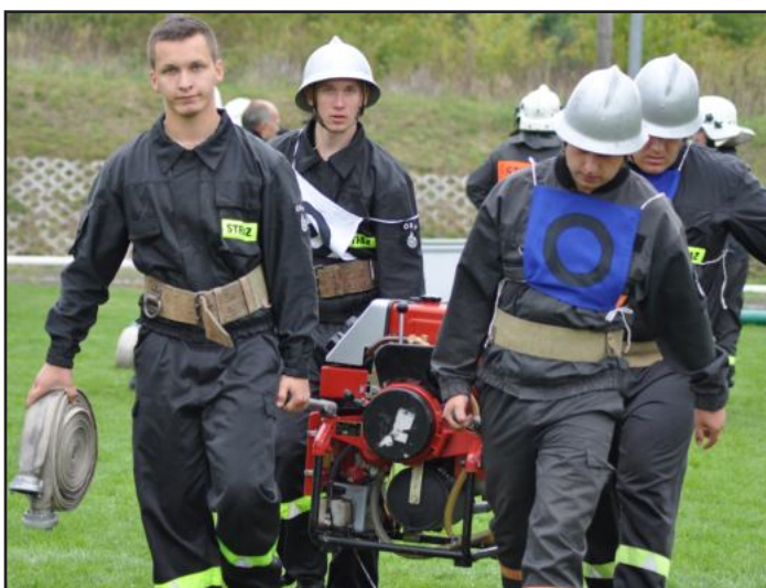
W ostatnim roku jednostka OSP Kozodrza dominowała podczas Gminnych Zawodów Strażackich.

Na terenie Gminy Ostrów funkcjonuje siedem jednostek OSP: Kamionka, Kozodrza, Ocieka, Ostrów, Wola Ociecka, Skrzyszów i Blizna. Najwięcej wyjazdów do akcji w poprzednim roku miała jednostka z Ostrowa, bo 22 działania. Kozodrza – 10, Ocieka – 6, Kamionka – 3, a Wola Ociecka – 2. W sumie 43 działania ratownicze w tym : 29 miejscowych zdarzeń, czyli między innymi wypadki i 14 pożarów. Natomiast do Krajowego Systemu Ratowniczo-Gaśniczego należą OSP Ostrów i Kozodrza. Oznacza to, że zasięg działania tych jednostek jest szerszy niż pozostałych pięciu, które funkcjonują w naszej gminie. Wszystko dlatego, że Krajowy Rejestr swoim zasięgiem działania obejmuje cały kraj. W praktyce wygląda to tak, iż OSP Kozodrza i Ostrów mogą