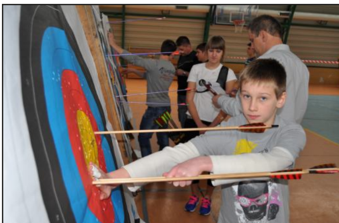
Turniej Łuczniczy przyciągnął prawdziwych zapaleńców tej dyscypliny