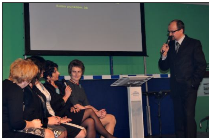
Jednym z punktów programu był teleturniej „Familiada” w którym panie zmierzyły się z panami. Panie oczywiście wygrały.