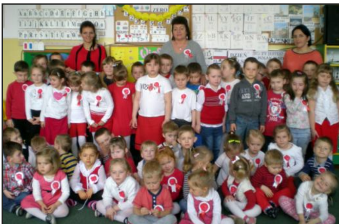
Przedszkolaki z Kozodrzy dumnie pozowały do wspólnego zdjęcia w pięknych biało-czerwonych kotylionach.

Dzieci najpierw poznają swoją najbliższą ojczyznę, zaznajamiają się z historią i tradycjami danej miejscowości i naszego kraju w nawiązaniu do wspomnień mieszkańców i legend. Poznają dawne stolice Polski oraz nazwy i położenie swojego województwa na mapie. Poznają również nazwy państw sąsiadujących z Polską. Uczą się hymnu narodo-