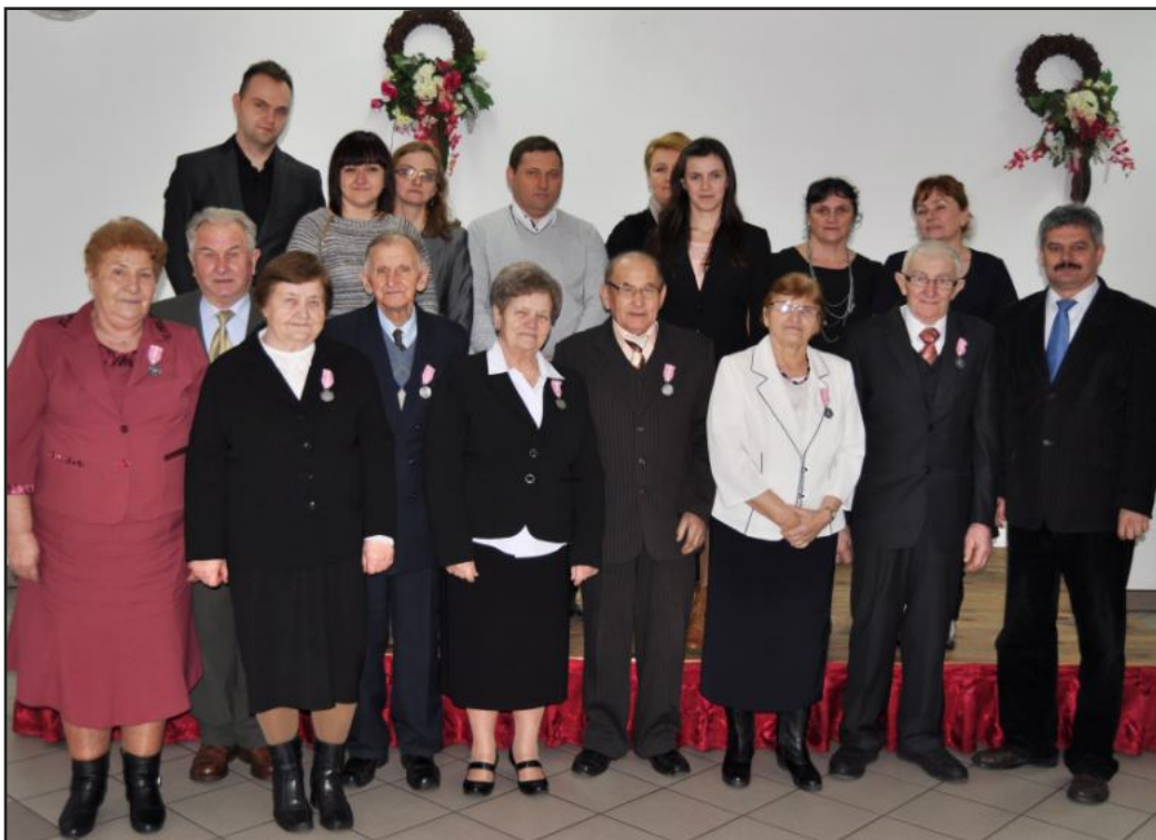
Podczas „Złoty Godów” parom towarzyszyli członkowie rodzin oraz Wójt Gminy Ostrów oraz kierownik Urzędu Stanu Cywilnego.