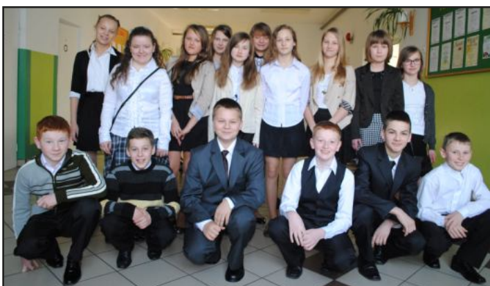
W sumie do testy szóstoklasistów na terenie naszej gminy jest 73. Jednak to w SP w Woli Ocieckiej ich liczba jest największa. Na zdjęciu uczniowie klasy VI z SP w Woli Ocieckiej w dniu sprawdzianu.

Test szóstoklasisty rozpoczął się po godz. 9:00 i trwał 60 minut. Dla szóstoklasistów z różnymi dysfunkcjami czas trwania egzaminu był przedłużony o dodatkowe 30 minut. Rozwiązane arkusze zostały zakodowane. Sprawdzając je