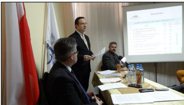
Podczas konferencji podejmowany był temat nielatywnej sytuacji komunikacyjnej związanej z brakiem zjazdów z autostradą