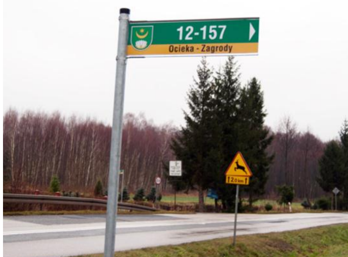
Tabliczki mają m.in. pomóc kierowcom służb ratowniczych w znalezieniu konkretnego domu.