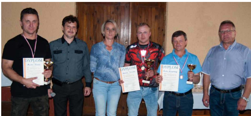
Nagrodzone osoby w turnieju luczniczym...