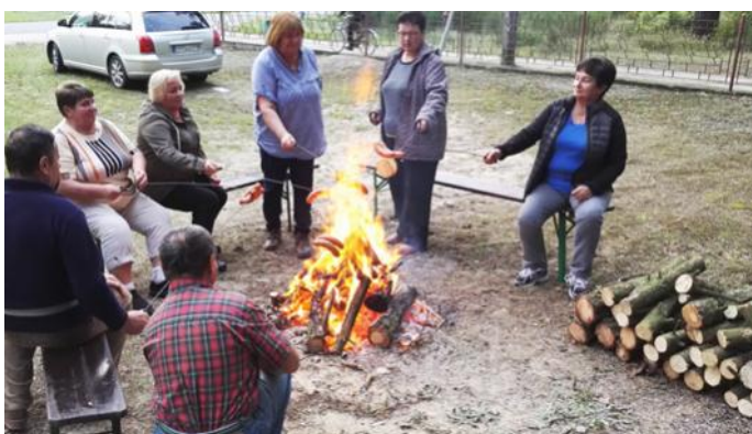
Tradycyjne ognisko z pieczoną kielbasą zorganizowane przy GCKiS w Kamionce

grywa się akcja filmu pt. „ Ojciec Mateusz”. Wielką atrakcją było dla nas półgo-