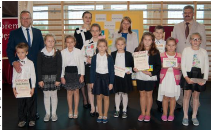
Pamiątkowe zdjęcie nagrodzonych dzieci.