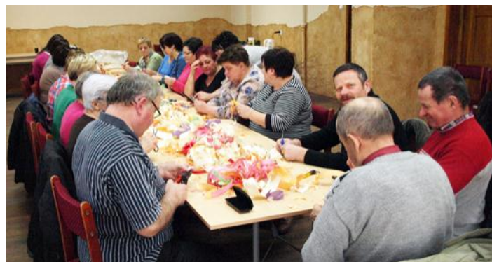
Kurs dekoracji świątecznych na Wielkanoc przyciągnął nie tylko panie ale również panów z Klubu Aktywnych w Kamionce

Pod koniec XVIII w. zamek znalazł się w posiadaniu rodziny Krasickich. W 1867 roku nabył go Feliks Dolański i wtedy urządzono tu secesyj-