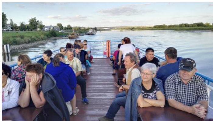
Klub Aktywny z Kamionki podczas pływania statkiem po Wiśle

Sandomierz leży we wschodniej części województwa świętokrzyskiego i należy do najstarszych miast w Polsce. Już w XI w. powstał tu gród. W czasach Kazimierza Wielkiego ( XIV w.) zbudowano mury obronne i wzniesiono południową wieżę. Za Zygmunta Starego budowę przekształcono w renesansową rezydencję i otoczono murem. W 1656 roku zamek wysadzili Szwedzi, ale go odbudowano. Było tu więzienie aż do 1959 roku, a obecnie jest tu muzeum.