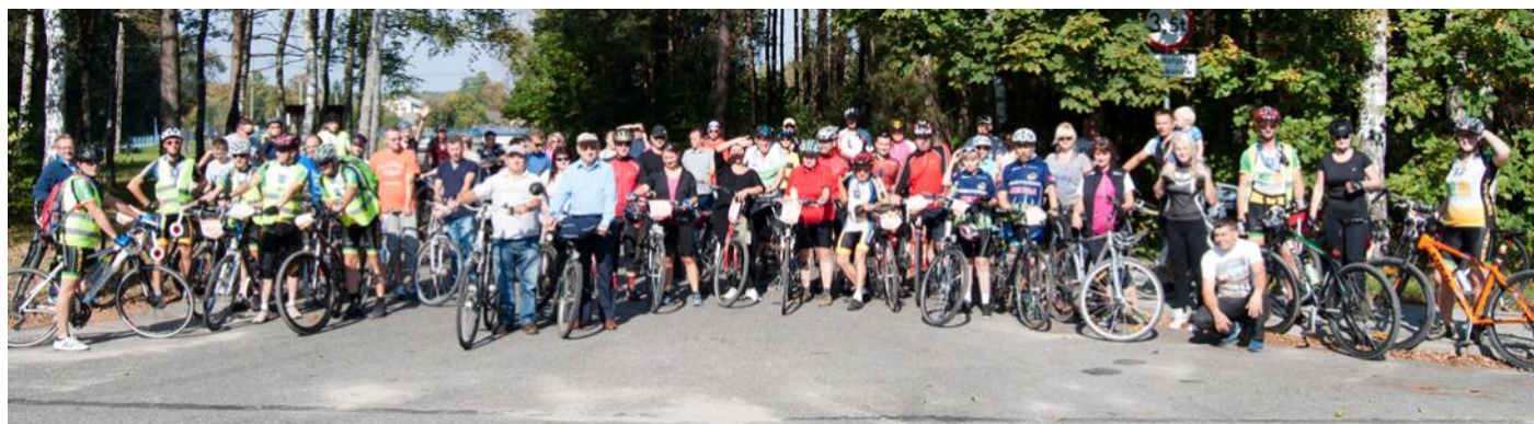
Pamiątkowe zdjęcie uczestników w okolicy zalewu w Kamionce