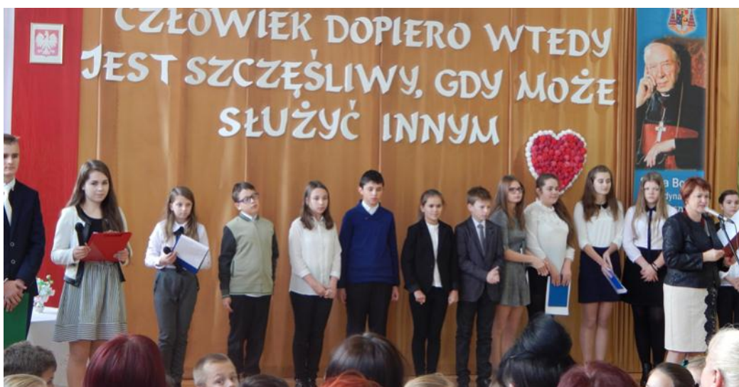
Uroczysta akademia w której wzięli udział uczniowie SP Ocieka