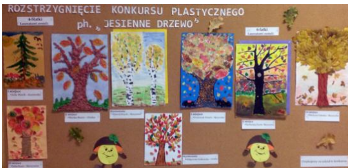
Na konkurs wpłynęło 40 prac, które wykonane były różnymi technikami plastycznymi.

Celem konkursu było dostrzeganie i rozpoznawanie zmian zachodzących w przyrodzie jesienią, rozwijanie wrażliwości i umiejętności plastycznych oraz popularyzacja dziecięcej twórczości plastycznej. Konkurs adresowany był dla wszystkich dzieci 3-4 oraz 5-6letnich. Prace należało dostarczyć do Oddziału Przedzszkolnego w Ociece do końca października. Na konkurs wpłynęło 40 prac. Wszystkie prace wykonane były różnymi technikami plastycznymi. 14 listopada br. oceny prac konkursowych dokonało jury powołane przez organizatora konkursu w składzie: pani