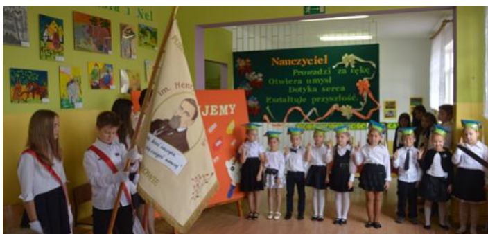
Moment uroczystego ślubowania...

scu, doświadczały szkolnego życia - jego smaku i koloru. Były pilne i pracowite. Wiedziały, że aby zostać przyjętym do braci uczniowskiej, trzeba udowodnić, że są tego godne. 20 października 2016