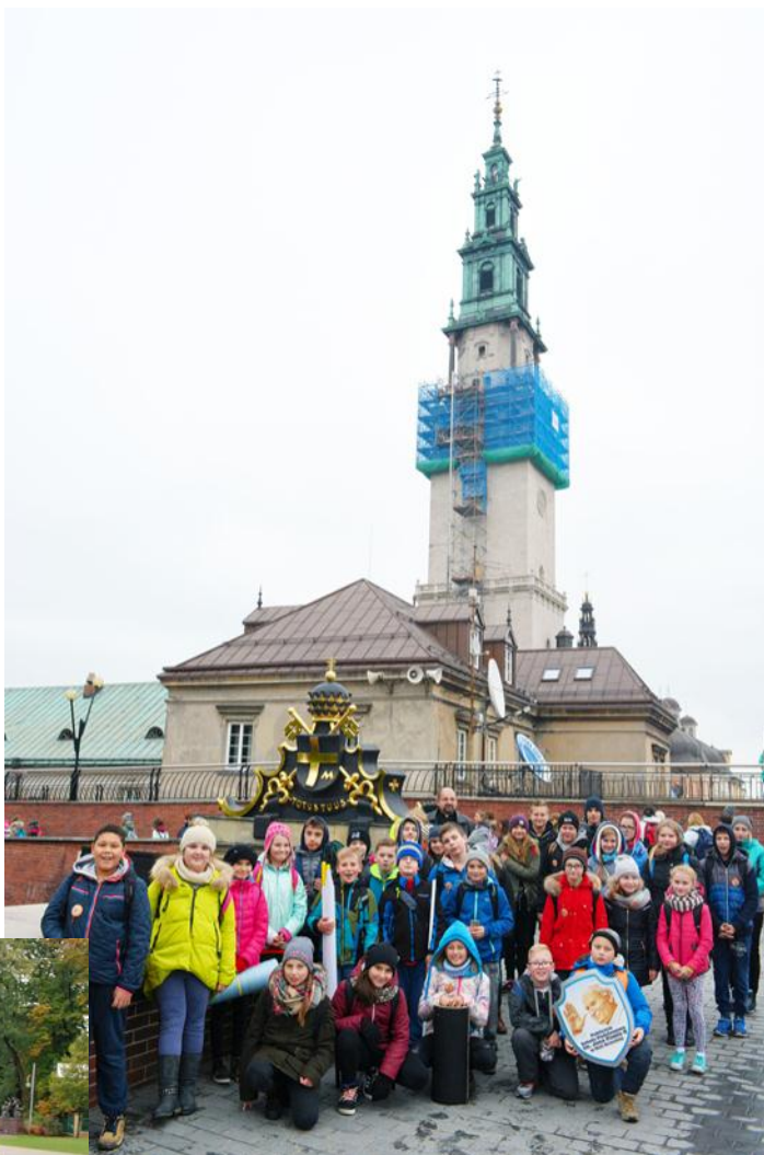
W pielgrzymce wzięło udział około 20 tysięcy uczniów z ponad 460 szkół. Wśród nich byli uczniowie z Woli Ocieckiej...

Po mszy świętej uczniowie pomodlili się przed obrazem Matki Boskiej Częstochowskiej, zwiedzili Skarbiec, Bastion Świętego Rocha. Nie zabrakło również czasu na