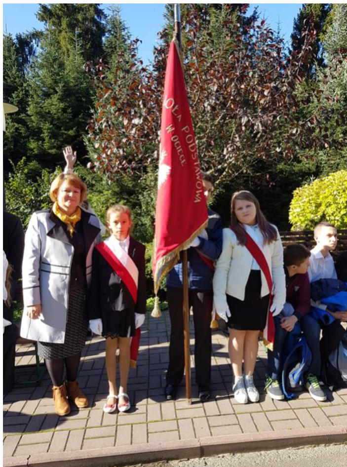
Delegacja z Ocieki ze sztandarem szkoły