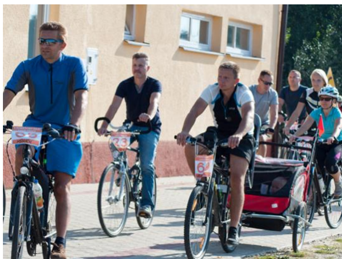
Rajd cieszy się dużą popularnością bez względu na wiek i doświadczenie w tego typu wycieczkach

podczas drugiego postoju rowerzyści zostali poczęstowani zupą pomidorową i napojami chłodzącymi. Po obfitym i pysznym posiłku wyruszyliśmy w dalszą trasę do Skrzyszowa. Na mecie, oprócz ciepłego jedzenia, na rowerzystów czekało wiele atrakcji: zawody łucznicze o puchar dyrektora szkoły przeprowadzone przez sołtysa