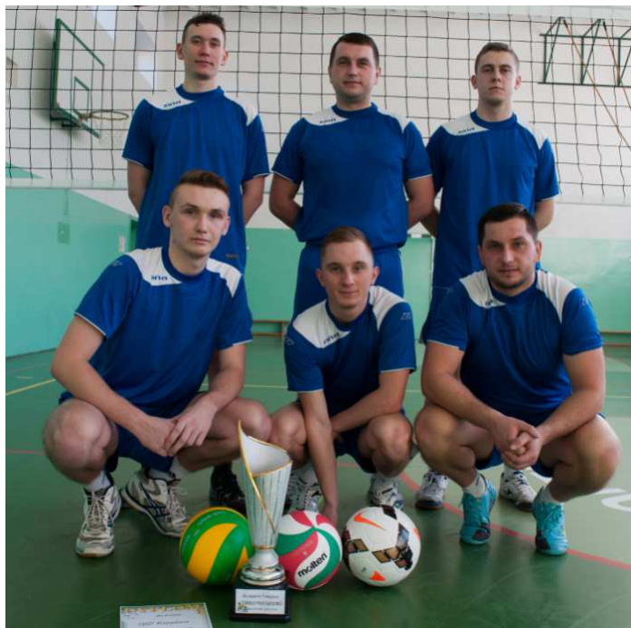
Najlepszą drużyną turnieju okazał się zespół OSP Kozodrza I

Już od samego rana na sali gimnastycznej w Woli Ocieckiej były rozgrywane emocjonujące rozgrywki. Po kilku godzinach gry w finałowym meczu spotkała się drużyna z Kozodrzy i Woli Ocieckiej,