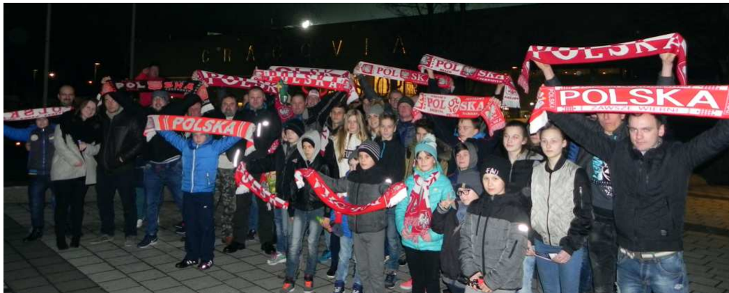
Oprócz treningów jest też możliwość z korzystania z różnego rodzaju wycieczek i wyjazdów na mecze