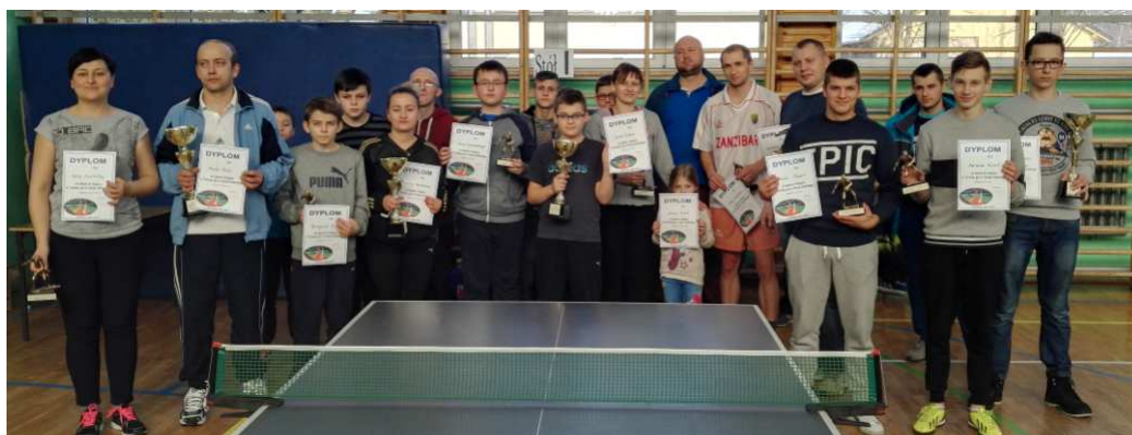
Pamiątkowe zdjęcie uczestników turnieju