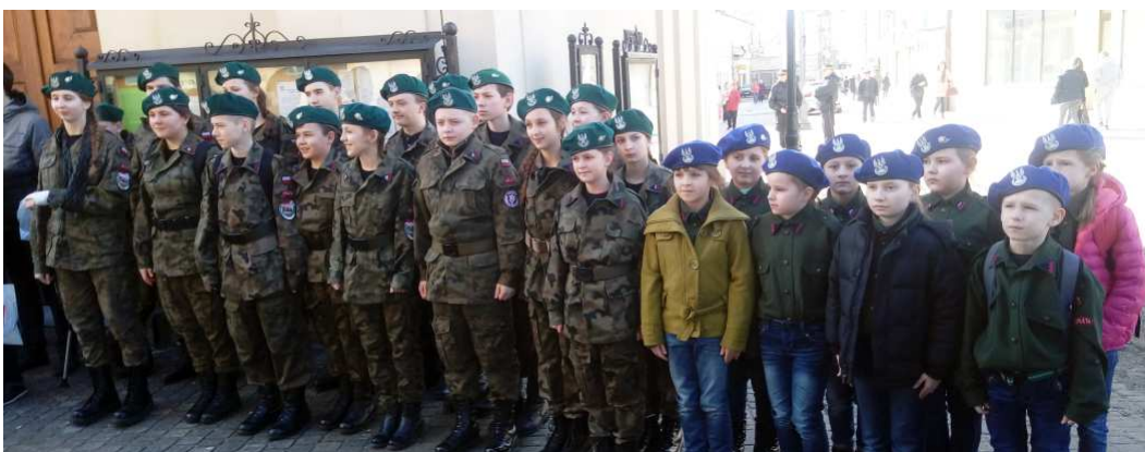
Dzieci i młodzież poznały zasady działania związku, której najważniejszą jest umiłowanie ojczyzny oraz intensywnie ćwiczyły musztrę wojskową, tym samym przygotowując się do złożenia uroczystej przysięgi Orłąt...

Od momentu zawiązania się organizacji, czas spotkań był wypełniony formowaniem się nowej drużyny. Dzieci i młodzież poznawały zasady działania związku, której najważniejszą jest umiłowanie ojczyzny oraz intensywnie ćwiczyły musztrę wojskową, tym samym przygotowując się do złożenia uroczystej przysięgi Orłąt, która jak co roku jest organizowana w rocznicę śmierci płk. Leopolda Lisa – Kuli, bliskiego współpracownika marszałka Józefa Piłsudskiego, bohatera rzeszowskiej ziemi. (W tym roku była to 98. rocznica.)