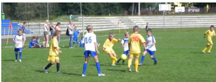
Działalność kluby KP Kaskada Kamionka pokazuje, że w małych klubach można dobrze wyszkolić zawodnika...

Nie zapominamy również o Reprezentacji Polski U21 na której mecze już cyklicznie jeździmy od kilku lat. 23 marca tego roku kibicowaliśmy naszej Reprezentacji, która rozgrywała towarzyskie spotkanie z reprezentacją Włoch. Na stadionie można było poznać „smak” tego co nas czeka w czerwcu, czyli Mistrzostwa Europy w Polsce.