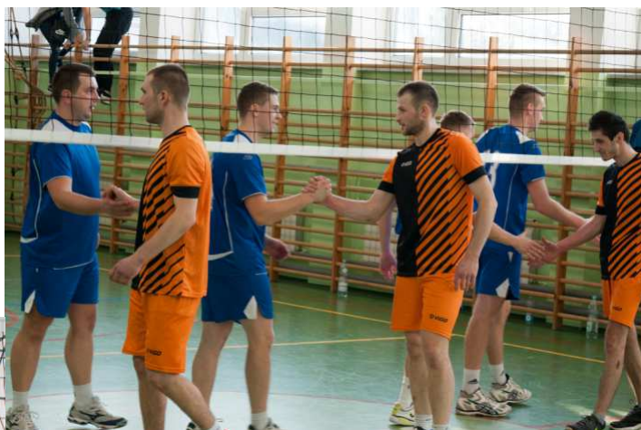
We finałowy meczu spotkała się drużyna z Kozodrzy i Woli Ocieckiej

który ostatecznie w trzecim secie zakończył się wygraną przyjezdnych.