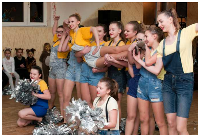
Zespół Anturja powstał w 2006r

ELMAT z Ropczyc, opiekacz, żelazko i mikser z firmy BOMIR ze Skrzyszowa i wiele, wiele innych ciekawych nagród, a także talony na zakup paliwa w CPN SPEED MAR w Ostrowie na kwotę 300 zł, dwa zaproszenia dla dwóch osób po 120 zł każde na uro-