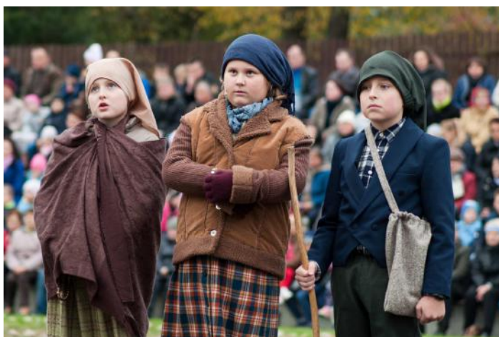
Prawie 60 osób wzięło udział w przygotowaniu misterium...

Warto również dodać, że to blisko aż 60 osób było zaangażowanych w stworzeniu tego misterium. Oprócz nauczania się swojej roli przez