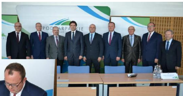
Podpisanie listów intencyjnych to pierwszy krok do realizacji inwestycji w Ostrowie

zła Autostrady A4 – węzeł Kolbuszowa”, „Budowa nowego węzła Autostrady A4 – węzeł Pilzno oraz łącznika drogowego od węzła do DK 94 w ciągu DK 73” a także dotycząca naszej gminy