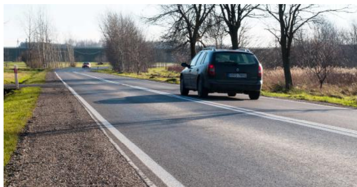
W mijającym roku został przebudowany blisko kilometrowy odcinek drogi wojewódzkiej w Ostrowie. W 2018 roku przewidziana jest dalsza przebudowa tej drogi w Ostrowie i Woli Ociecekiej...

- W mijającym roku samorządy Województwa Podkarpackiego oraz Gminy Ostrów zrealizowały wspólnie przebudowę drogi wojewódzkiej w Ostrowie, polegającej na wykonaniu nawierzchni z masy mineralno-bitumicznej,