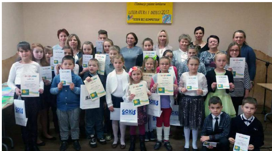
Zdjęcie laureatów gminnych eliminacji