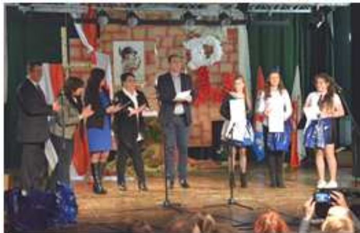
Moment wręczenia pamiątkowych dyplomów i nagród