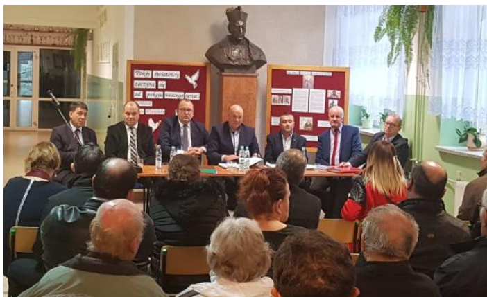
Na zebraniu wiejskim w Ociece uczestniczyło ponad 80 mieszkańców...

Prace geodezyjne i kartograficzne wykonywane będą aż do dnia 31 października 2018. W tym czasie mieszkańcy jak i właściciele działek z tych 4 miejscowości mogą otrzymać zawiadomienia o udziale w realizacji tych prac. Dodatkowo warto wiedzieć, że pracownicy OPGK S.A. zgodnie z prawem mają również prawo wejść na daną nieruchomości oraz dokonać niezbędnych czynności związanych z wykonywanymi pracami. Modernizacja ewidencji gruntów wykonywana jest w celu m.in. doprowadzenia do zgodności danych zawartych w operacie ewidencji grun-