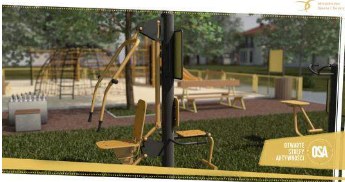
Jeszcze w tym roku w Ostrowie, Skrzyszowie, Kamionce, Woli Ocieckiej i Ociece powstaną tzw. Otwarte Strefy Aktywności...

nych, których nawierzchnia jest w najgorszym stanie będzie odnowionych. Jeśli chodzi o nasze gminne drogi asfaltowe to trzeba powiedzieć, że ostatnie mroźne zimy bardzo mocno je poniszczyły. W związku z informacją Premiera RP Mateusza Morawieckiego na rok 2019 przewidziano z rządowego programu przebudowę dróg lokalnych pięciokrotnie więcej funduszy na modernizację dróg gminnych niż kiedykolwiek do tej pory. Nabór wniosków ma pojawić się jesienią 2018r., dlatego już teraz przy-