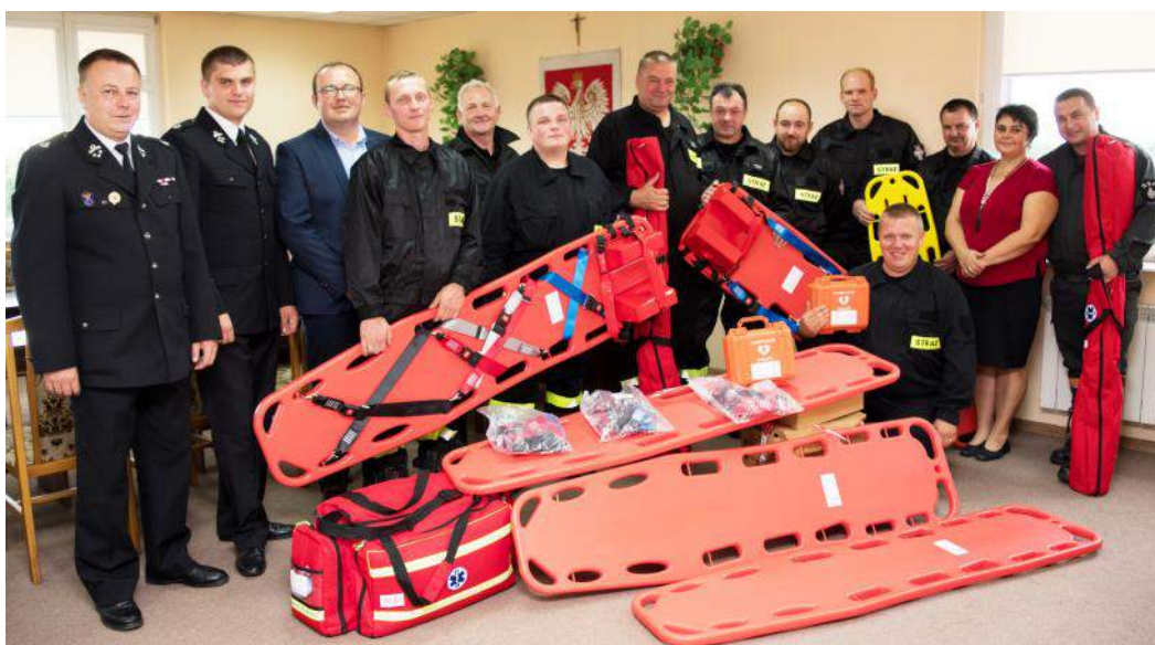
Strażacy prezentują otrzymany sprzęt...

Podczas spotkania rozmawiano o najbliższych planach jednostek OSP oraz również była to okazja do wręczenia nowego sprzętu wartości blisko 25 tys. zł dla jednostek OSP z naszej gminy. Wśród przekazanego wyposażenia znalazły się m.in. dwa defibrylatory (trafiły do jednostek