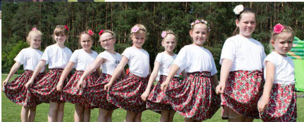
Zespół taneczny działający przy GCKiS w Kamionce

Humory uczestnikom dopisywały, bo atrakcji nie brakowało. Na początek były występy