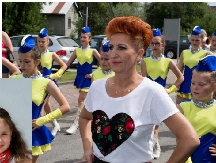
Tradycją festynu był przemarsz Orkiestry Dętej z Dębicy z mażoretkami z zespołu Anturja ze Skrzyszowa

Wspólna zabawa oraz radość dla tych mniejszych i trochę większych była możliwa dzięki bogatemu wachlarzowi proponowanych atrakcji.