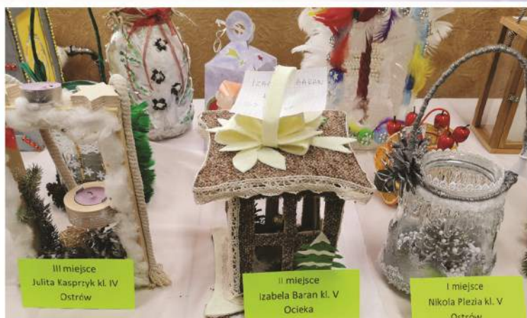
III miejsce Julita Kasprzyk kl. IV Ostrow