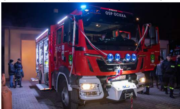
Nowe samochody dla OSP Ocieka i OSP Kamionka kosztowały prawie 1,5 mln zł

żeniami UE i Polski musimy co roku dążyć do zwiększania poziomów odzysku odpadów w taki sposób aby jak najmniej trafiało na składowisko, a jak najwięcej zostało ponownie wykorzystane. Nowa instalacja pozwoli w przyszłości gospodarować odpadami