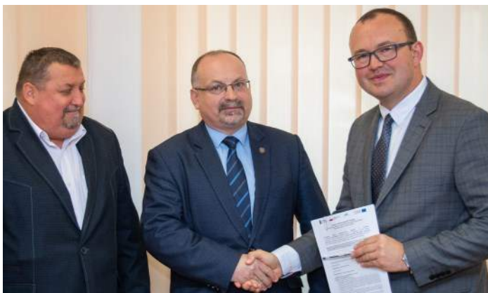
Calkowita wartość rozbudowy ZZO w Kozodrzy to według kosztorysu inwestorskiego to aż 9 349 414,95 zł przyznane dofinansowanie to 6 460 977,78 zł

Jeszcze wiele innych ważnych inwestycji zostało wykonane w mijającym roku w naszej gminie ale chyba za największy sukces uważam to, że wszystko to co Państwu przytoczyłem jak również te rzeczy, o których przeczytają Państwo w kolejnych artykułach tego numeru Życia Ostrowa zostało zrealizowane bez zaciągania kredytów. Jest to niezwykle ważne, gdyż najbliższe 2 lata to okres kiedy dobiega końca obecna perspektywa finansowa UE, oznacza to, że będzie praktycznie niemożliwe pozyskanie dofinansowania, więc chcąc dalej inwestować będziemy musieli korzystać ze środków własnych bądź wspomagać się kredytem. Na kolejne dofinansowania musimy poczekać do zatwierdzenia nowego unijnego budżetu.